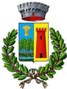
comune di Boltiere